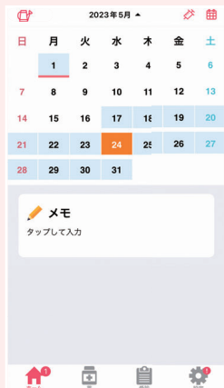
▶ 注射スケジュールの案内