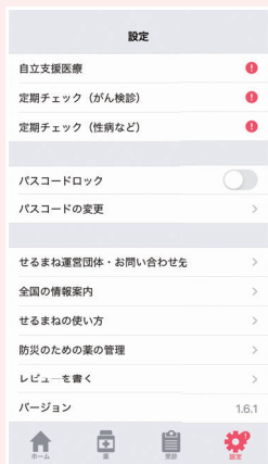
▶ 自立支援更新案内と定期検査の案内