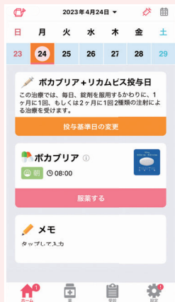
▶ 注射基準日の登録