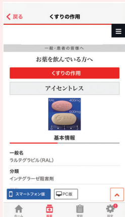
▶ くすりの作用を確認